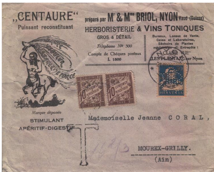
Beleg der Perfin B 61