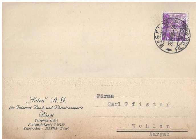
Beleg der Perfin S 3